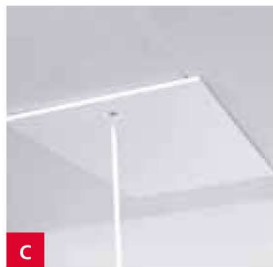
C Spodní víko překrývá rám schodů, které skrývá drážku mezi schody a rámem