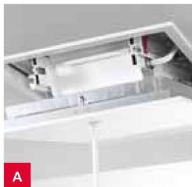
A dvojitý falc spodního víka 10cm silný